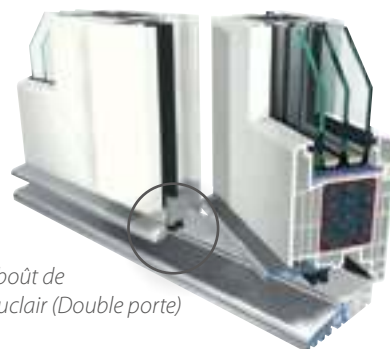
Emboût de maclair (Double porte)

En outre la porte de maison S 9000 va vous convaincre par les arguments suivants: